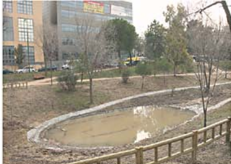
Tres balsas de agua jalonan el recorrido del antiguo Arroyo de Rejas en Las Mercedes.

Otro de los grandes logros de esta Asociación Vecinal con marcado carácter ecologista ha sido poner en marcha el llamado Parque de las Pro-