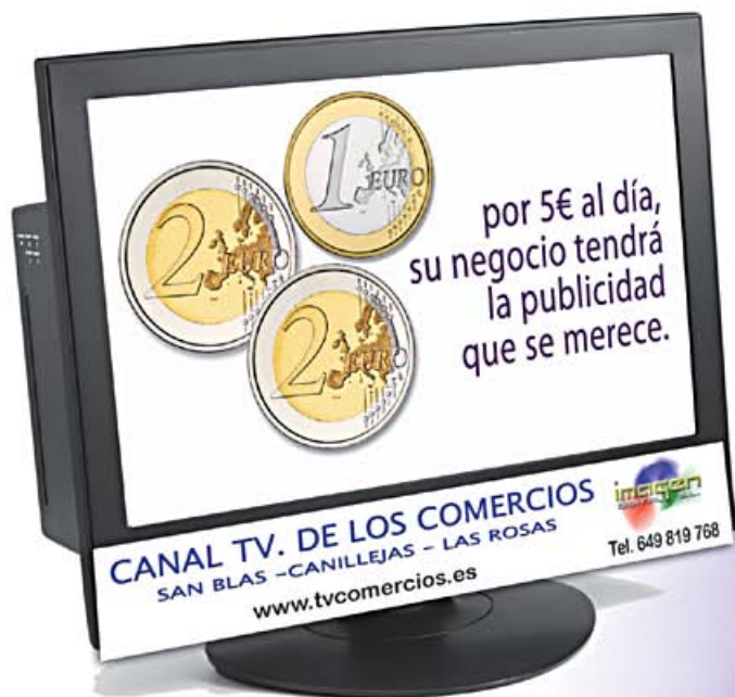
imagen DIGITAL S.L. tv. comercios