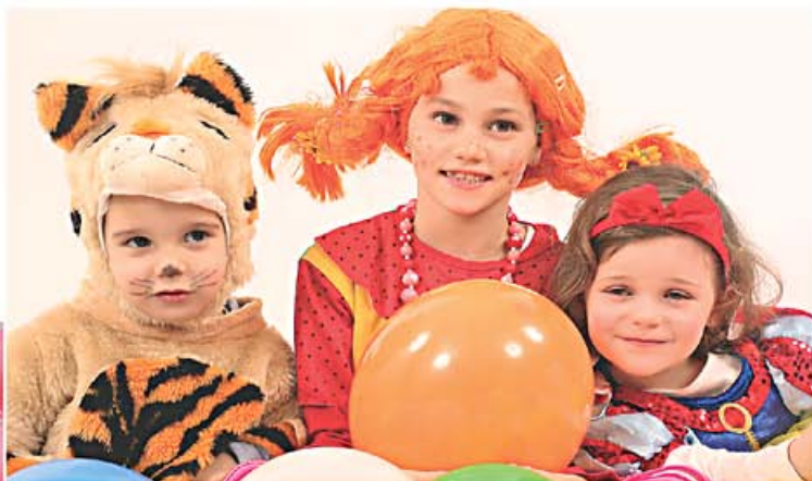
Los niños serán los auténticos protagonistas del día 14 en el Paseo de Ginebra (Las Rosas), donde se ubica el escenario principal.

E ste año el Carnaval de Las Rosas coincide con San Valentín, el día de los enamorados, una fecha que será inolvidable para los que estén enamorados, los que aspiran a estarlo y sobre todo para los niños, auténticos protagonistas de la fiesta infantil preparada con esmero por la