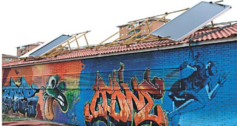
Las instalaciones deportivas del campo Antonio Palacios presentan un estado deplorable. A la izquierda los caballos siguen pastando en Rejas.

distrito. "Las competencias las tenemos por delegación del alcalde; nuestra labor, entre otras, es trasladar las inquietudes de los vecinos al Ayuntamiento o a otras administraciones y no tenemos competencias ejecutivas. No es baladí nuestra función y no podemos menospreciar a las juntas", declaró. González repasó los acuerdos de los tres grupos municipales en la presente legislatura con un total de 82, de ellos 53 por unanimidad y 53 con enmiendas transaccionales. Ocho propuestas fueron rechazadas y cinco retiradas por el principal partido de la oposición. "Por tanto —enfaticó la