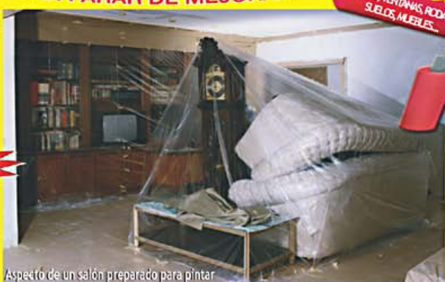
Aspecto de un salón preparado para pintar

Incluye Gotelé nuevo y terminación plástica lavable en distintos colores