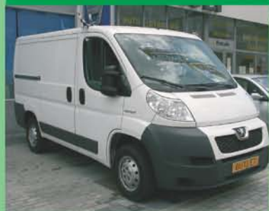
Peugeot Boxer Año 2008