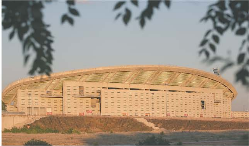
Tras el verano y antes de finales de a3o deber3an comenzar las obras del Sector Ol3mpico. Abajo, los t3cnicos municipales informando a los vecinos

Plan de Movilidad Sostenible. - El Atl3tico de Madrid gestionar3 los planes de seguridad para los eventos deportivos y para ello los accesos tienen que ser 3giles y seguros. El uso principal deber3a ser el transporte colectivo (Metro) adem3s de las 3reas intermodales. El propio club gestiona sus