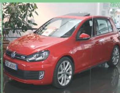
V Golf VI Año 2005