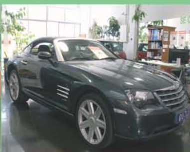
Crysler CossFire Año 2007