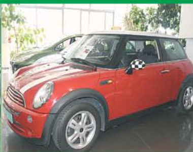
Mini One Año 2005