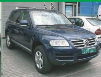
V Tuareg Año 2005