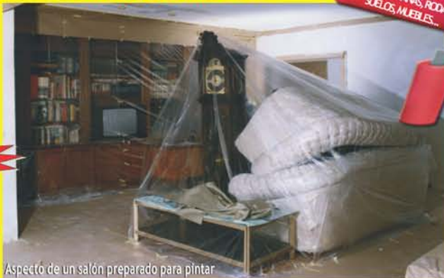
Aspecto de un salón preparado para pintar

Incluye Gotelé nuevo y terminación plástica lavable en distintos colores