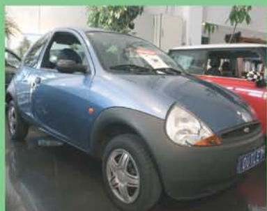
Ford kA Año 2003