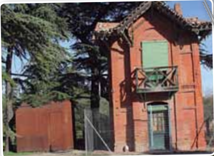
La PQTA pretende recuperar el antiguo viñedo de Torre Arias y el ciclo hídrico del agua entre otras actuaciones.