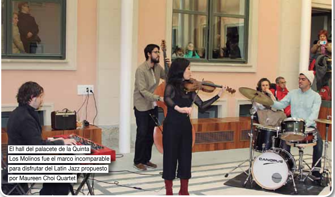
El hall del palacete de la Quinta Los Molinos fue el marco incomparable para disfrutar del Latin Jazz propuesto por Maureen Choi Quartet

culturales. El primer álbum de jazz de Maureen Choi Quartet apareció en 2011 y tuvo una magnífica acogida entre al crítica especializada estadounidense, en la radio, y también en publicaciones musicales como Jazziz Magazine, Jazz Corner y demás se mantuvo en el Top 50 de All About Jazz durante varios meses. En 2013 Maureen Choi publicó su segundo disco llamado Valentía, en el que transmite todas sus influencias musicales y donde mezcla con valentía nunca mejor dicho la