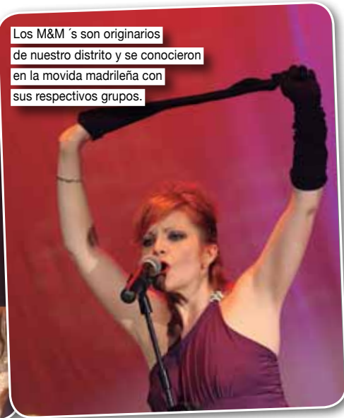
Los M&M's son originarios de nuestro distrito y se conocieron en la movida madrileña con sus respectivos grupos.