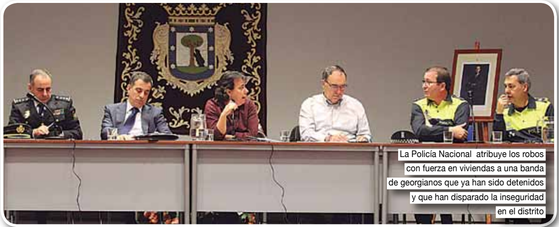
La Policía Nacional atribuye los robos con fuerza en viviendas a una banda de georgianos que ya han sido detenidos y que han disparado la inseguridad en el distrito